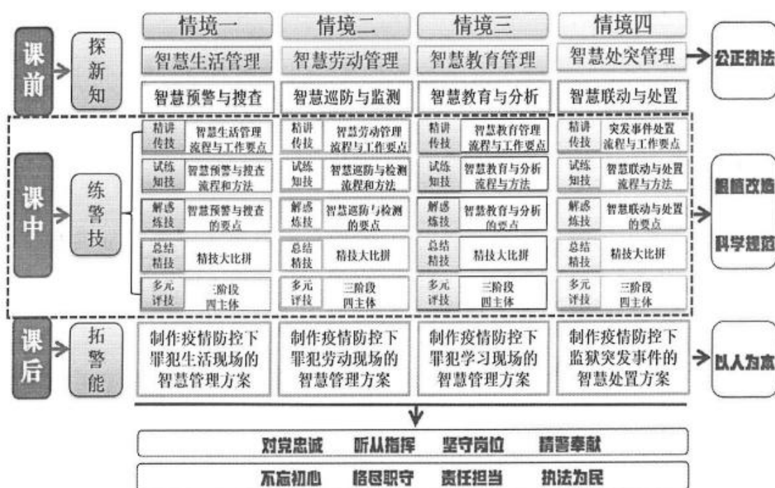
图1 课程思政教学流程图

种教学方法相结合有效调动学生课堂参与的主动性,通过监所岗位典型工作情境融入警察文化自信、职业素养、讲好警察故事。贯穿“铸警魂、担使命、砺精兵”的三层递进式的课程思政体系,以国家职业教育智慧教育平台为支撑,覆盖“学生—学警”的角色转换全过程,实现学生专业技能与职业素养的深度融合,完成从入门—提高—精通—专业的转变。