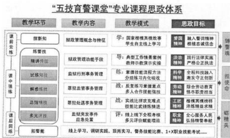
图3 “五技育警课堂”专业课程思政体系图

设计“学—导—练—战—评”五位一体的教学模式，融合“铸警魂、担使命、砺精兵”的三个层面逐层递进的专业课程思政，结合“警勋银行”评价系统，拓展第二课堂教学空间，打造“五技育警课堂”，全面实施“3+3+3”课程思政教学改革。打造依托“课程思政+”为背景的岗位管理工作流程教学内容，不仅全程融入监狱常态化管理核心要素，同时注重融合二十大精神及监狱智慧管理新成果，切实服务法治广东、平安广东。